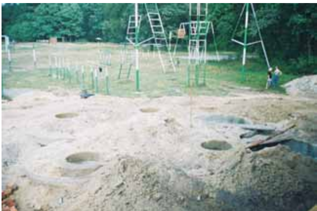
Тепер стічні води на спортивний майданчик не виливаються

П'ять причин відвідати Конвенцію PI 2009