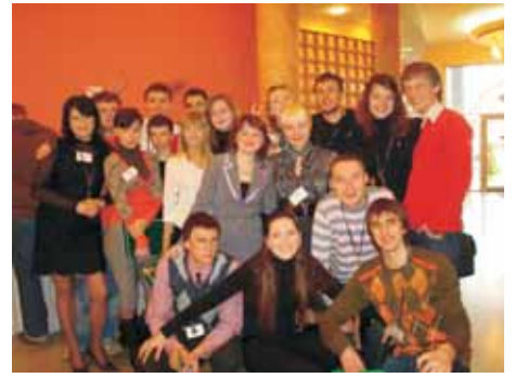
Українські Ротарактивці на Конференції в Лодзі

І закипіла робота. Клуби ділилися своїми досягненнями за минулий рік. Всі