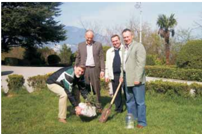
Традиційна посадка дерев біля Лівадійського Палацу