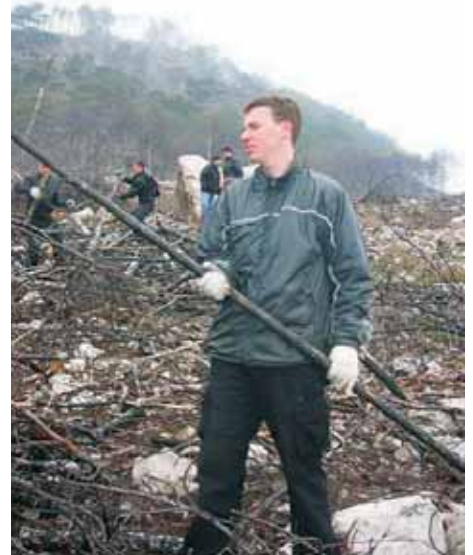
Ротаріанський десант розбирає завали лісового згарища

Цього року в акції взяли участь більше 100 осіб, які, не зважаючи на більш, ніж суворі погодні умови, зробили все можливе і неможливе, аби внести свій вклад до поповнення родини вічно-зелених дерев, сподіваючись, що в майбутньому вони стануть гордістю і справжнім скарбом південного берегу Криму і всієї України!