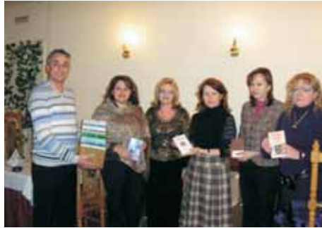
Передача книг харківськими Ротарійцями