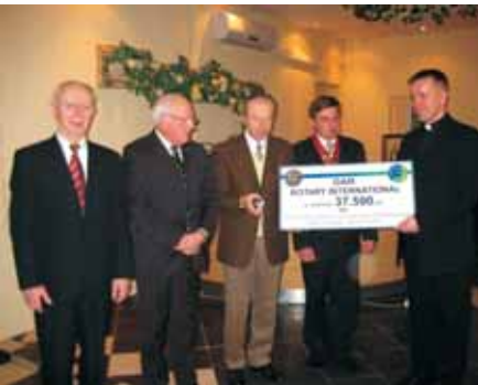
Символічна передача чека для здійснення проекту станції очищення води в Будинку відпочинку в Пуці