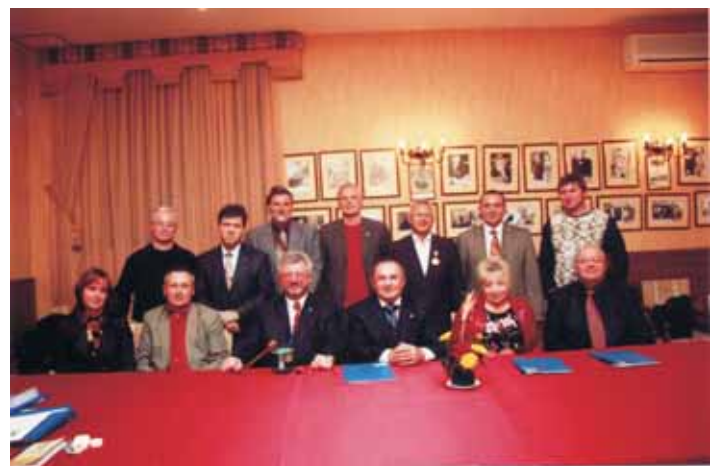
На засіданні Ротарі Клубу Ялта