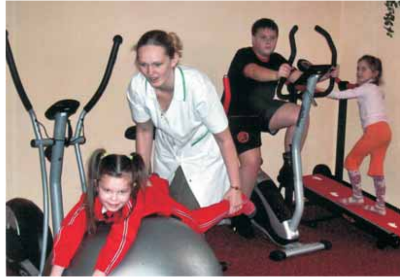
Тренажери для маленьких пацієнтів