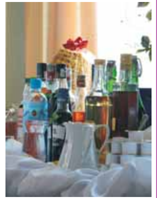
Айвівки, барбарисівки, горіхівки...

З невідомою щирістю і задоволенням Президент Януш Денісюк і РК Бяла Подляска запрошують до загальної дегустації в атмосфері дружби і братерства, до задоволення, завдяки якій ми познайомимося краще, а прибуток ми використаємо, як завжди, на благодійні справи.