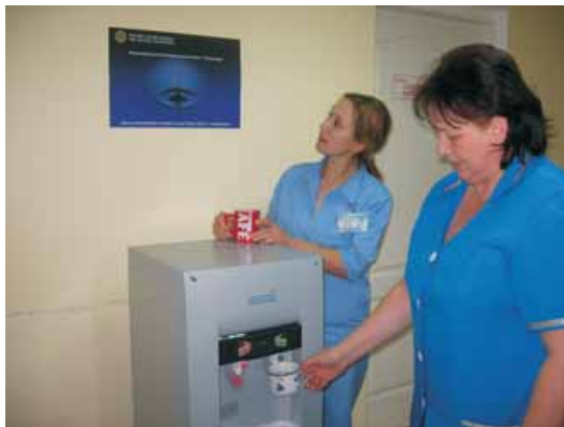
Перевірка системи водоочищення у Сімферопольському пологовому будинку № 1.