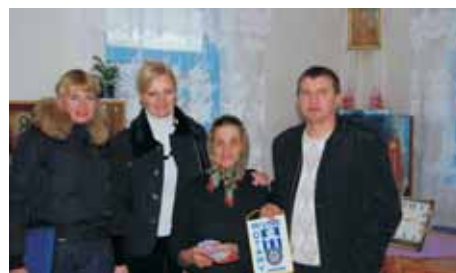
Ротарійці РК Рівне надають грошову допомогу постраждалим від повені

Найбільше на Рівненщині постраждали жителі Володимирецького району: було підтоплено 150 житлових будинків, 600 присадибних ділянок, розмиті два водні канали, пошкоджено 10 перехідних мостових споруд, згоріли 2 трансформаторні підстанції. Обсяг збитків склав близько 5 мільйонів гривень.