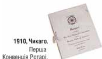
1910, Чикаго. Перша Конвенція Ротарі.

1921, Едінбург. Шотландія Перша Конвенція за межами Сполучених Штатів залучила понад 2 500 учасників.