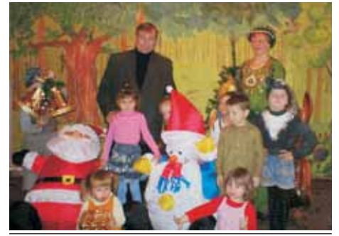
Новорічне свято у дитячому садку «Гніздечко»

Протягом останніх років дитячий заклад упроваджує педагогічну систему, розроблену Василем Сухомлинським. Діти зі спецгрупи разом з дітьми із загальних груп садять кущі та дерева, працюють на городі, разом відзначають свята, спілкуються і проводять творчі ігри. Така форма роботи сприяє формуванню міжособистісних відносин, допомагає кожній дитині відчути себе справжнім партнером, отримати радість і позитивні емоції.