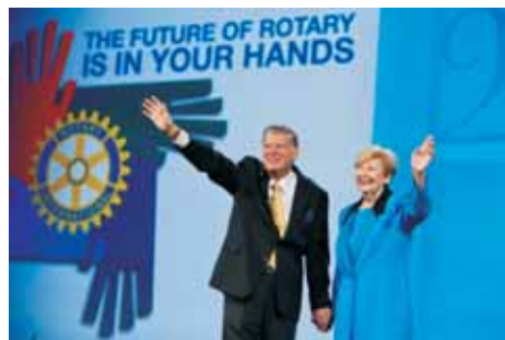
Президент-Елект РІ Джон Кенні з дружиною Джун

«Покоління Ротарійців минулого стоять за нами, і ми відповідальні перед ними і самими собою за майбутнє Ротарі», - підкреслив він.