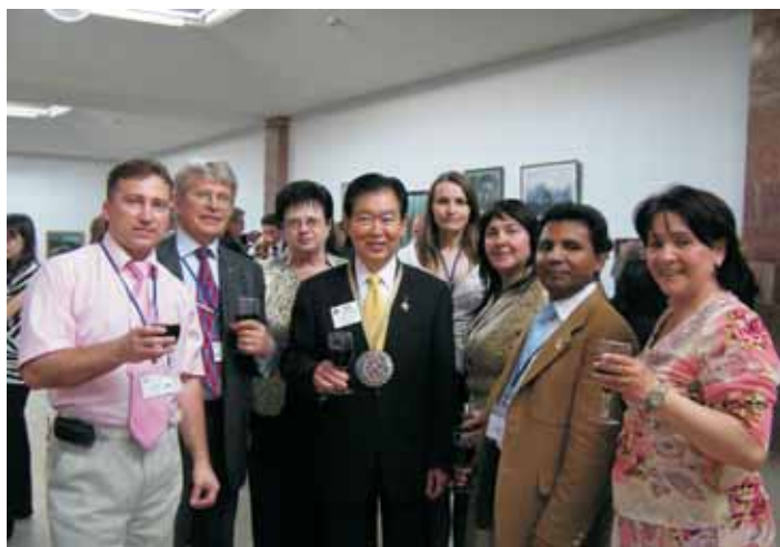
Ротарійці РК Київ Центр разом з Генеральним Секретарем РІ Едом Футоу