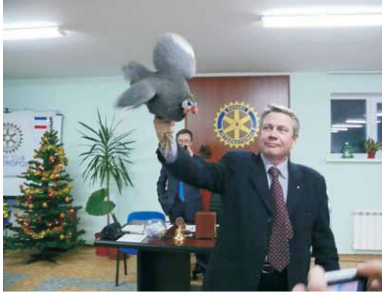
Цесарки – найбільш оригінальний лот сімферопольського аукціону

Загалом було зібрано близько 10 тисяч гривень. Реципієнтами аукціону стали Республіканське товариство інвалідів, Сімферопольська спеціальна школа-інтернат № 1, ініціативна група, що збирає кошти для придбання ме-