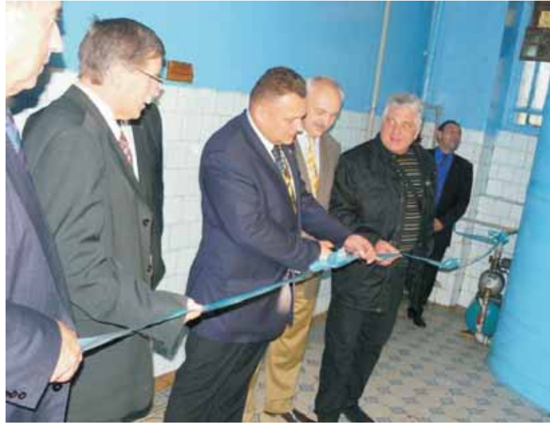
Президент РК Львів Юрій Самура урочисто відкриває установку для очищення води.

Копенгагена подарували Сколівським дітям сучасну установку для очищення води з резервуаром на 5000 літрів. Цієї кількості води вистачає для приготування їжі дітям всієї школи. До того ж на кожному поверсі діти мають цілодобовий