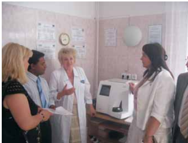
Установка обладнання у Київській міській туберкульозній лікарні.