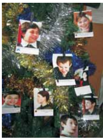
Ялінка для збору подарунків для дітей інтернату