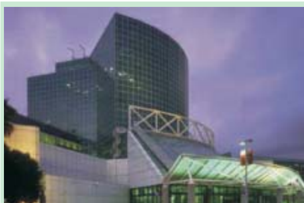
Ротарійці, які беруть участь у конвенції РІ 2008, підтримали ідею привезти по одній книзі для проекту з підвищення грамотності американських школярів.

Верк закликає всіх учасників конвенції РІ 2008 приєднатися до цієї історичної події і привезти з собою одну чи кілька книг на будь-якій мові. Організатори також сподіваються, що ця ініціатива встановить рекорд найбільшо-