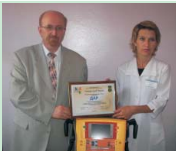
Дефібрилятор с кардіомонитором установлен в хирургическом отделении больницы в г. Глуске.

Мінські ротарієць взяли на себе організаційну підтримку задуманого. Вона полягала у веденні листування і теле-