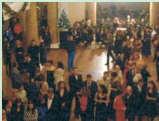
Новорічний благодійний бал у Запоріжжі