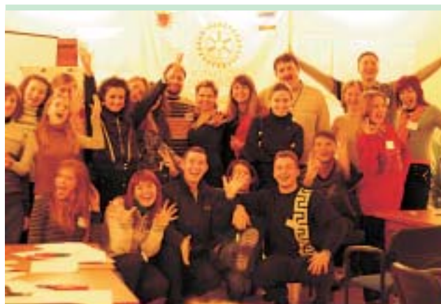
Благодаря тренінгу, мы поняли, что РОТАРАКТ — это ШКОЛА О ПОБЕДЕ ПОБЕД».

гато, ми, скоріше, структурували наявні знання, ніби матеріалізували їх для себе. Завдяки участі в тренінгу в нас з'явилася безліч нових думок з приводу того, як можна реалізувати вже наявні ідеї, використовуючи отриманий досвід.