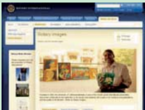
ФОТО ПРО РОТАРІ ТЕПЕР ДОСТУПНІ ОН-ЛАЙН

Нова особливість на веб-сайті РІ дозволяє ротарійцям шукати й одержувати доступ до тисяч фотографій, які розповідають про Ротарі. Розділ Rotary Images - це бібліотека фотографій, якою може скористатися кожен ротарієць.