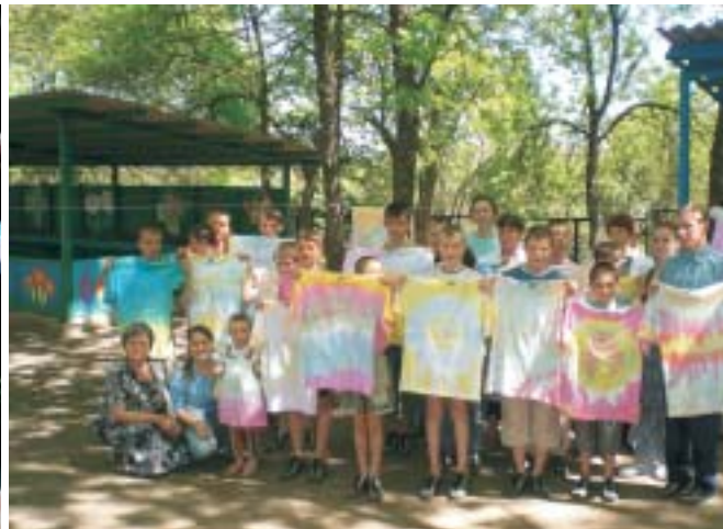
Харківські учні з інтернату навчилися виварювати футболки за спеціальною технологією.