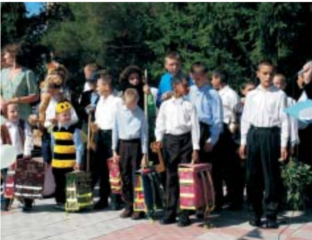
Ротарійські подарунки до Дня знань у Шевченківському будинку-інтернаті.