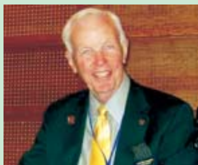
Зараз, як ніколи, ми повинні назавжди зупинити поліомієліт

Багато хто з Вас знає, що зараз ми об'єднали наші зусилля в боротьбі з поліомієлітом. За два десятиліття, завдяки неймовірній великодушності і фантастичній відданості ротарійців в усьому світі, ми скоротили інфікування поліомієлітом більш, ніж на 99%, а країн, інфікованих поліомієлітом, залишилося тільки чотири. Ми зменшили щорічні випадки паралічу від 350 000 до приблизно 1 000. Ми домоглися занадто багато чого, щоб зараз зазнати невдачі.