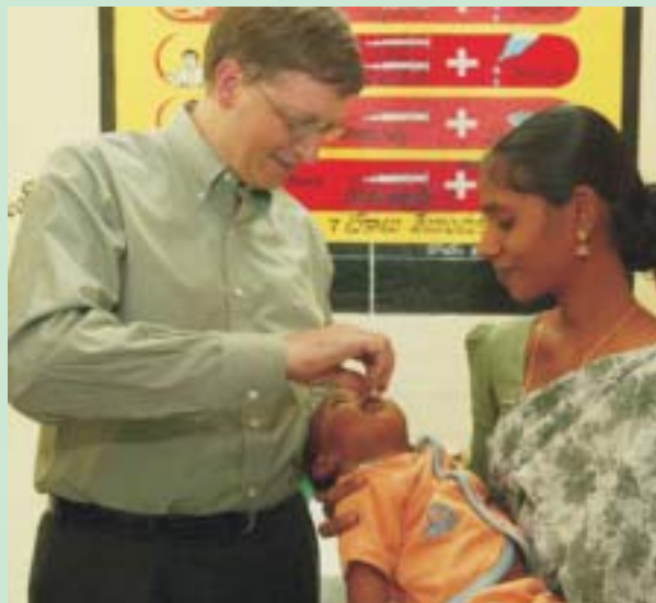
Білл Гейтс, співзасновник Фонду Білла і Мелінди Гейтс, дає поліо-вакцину дитині в громадській лікувальній клініці Шаднагар в Андхра-Прадеші, Індія, листопад 2002 р.

Викорінення поліомієліту є головним пріоритетом Ротарі з 1985 року, з фінансовими вливаннями на за-