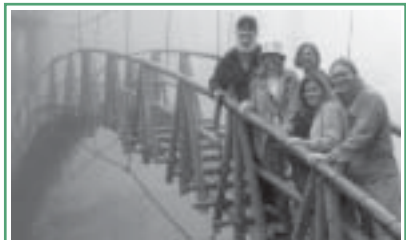
GSE: Україна збирається в Америку стор. 4