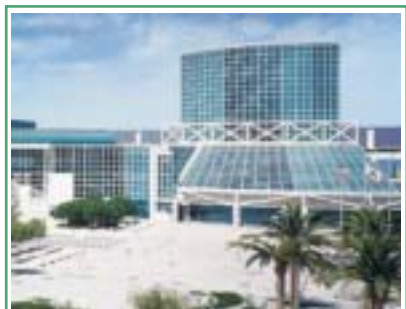
Книжна гора на Конвенції РІ стор. 9