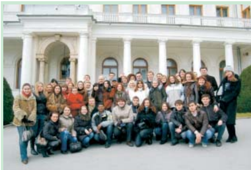
Учасники конференції під час екскурсії до Ливадійського Палацу.

дань клубу Ротаракт в якості доповідачів, а також приймати найбільш активних, досвідчених ротарактивців, які досягли певних вершин у кар'єрі і служінні людям, у Ротарі-клуби незалежно від їхнього віку.